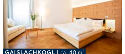
GAISLACHKOGL | ca. 40 m 2

Street-facing double room with balcony, double couch, bath or shower, separate WC, minibar, telephone, digital TV, radio and safe.