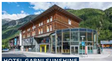
HOTEL GARNI SUNSHINE