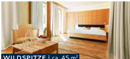
WILDSPITZE | ca. 45 m 2

Quiet double room with balcony, double couch, bath and shower, separate WC, minibar, telephone, digital TV, radio and safe.