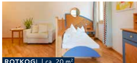
ROTKOGL | ca. 20 m 2

Double room with south-facing balcony, double couch, sliding glass door with a curtain, heat bench, bath and shower, WC, minibar, telephone, digital TV, radio and safe.