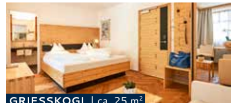
GRIESSKOGL | ca. 25 m 2

Single room with bath and shower facilities, WC, minibar, telephone, digital TV, radio and safe.