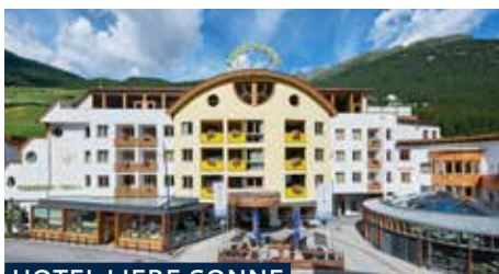
HOTEL LIEBE SONNE